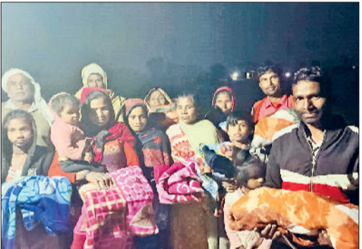
राजौंद। बालाजी भूषे पर लोगों को गर्म कंबल वितरित करते सेवादर।