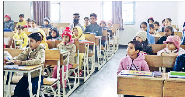
जींद। प्रवेश के लिए परीक्षा देते हुए बच्चे।