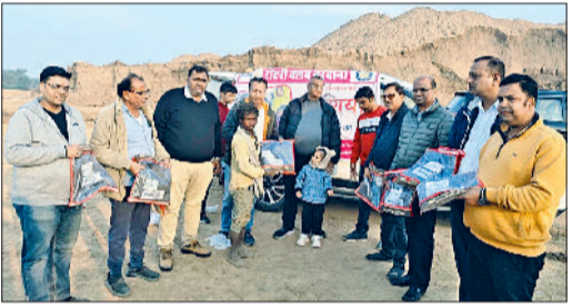
नरवाना। गरम वस्त्र वितरित करते हुए।