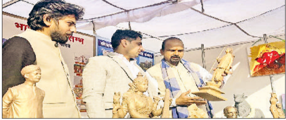
जींद। हाईकोर्ट की न्यायाधीश को कला कृति भरते दीपक कोशिश।

इंडस वैली सिविलाइजेशन की सबसे बड़ी पुरातात्विक साइट राखीगढ़ी में पुरातत्व विभाग एवं संग्रहालय के तत्वावधान में तीन दिवसीय राखीगढ़ी महोत्सव का भव्य आयोजन किया। महोत्सव में देशभर से आए कलाकार अपनी कला प्रतिभा का प्रदर्शन कर रहे हैं। महोत्सव के अंतर्गत स्टूडियो माटी आर्ट, सोल एंड स्पिरिट आर्ट सोसाइटी, गोपाल विद्या मंदिर, चारकोल डिजाइन, सिंधु ग्रुप ऑफ एजुकेशन और भारत मित्र स्तंभ के संयुक्त तत्वावधान में कला की विभिन्न विधाओं को एक मंच पर प्रदर्शित करने का अवसर मिला।