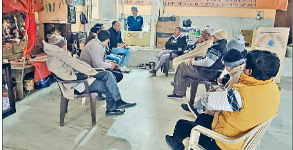
सीवन। गोशाला में आयोजित बैठक में भाग लेते सदस्य।

वार्षिक खेलकूद प्रतियोगिता में खिलाड़ियों ने मैदान में प्रतिद्वंद्वी को परास्त करने की जद्दोजहद करते अलग-अलग कैटेगरी के मुकामलों में टैम भागने के साथ ही अपने अन्दर छिपी खेल प्रतिभा को खुलकर अभिव्यक्त किया। स्कूल मैनेजर ने बताया कि बच्चों को खेल के प्रति प्रोत्साहित करने के उद्देश्य को लेकर ही स्कूल में स्पोर्ट्स मीट का आयोजन किया गया। मुख्य अतिथि ने बच्चों को संबोधित करते कहा कि मजबूत राष्ट्र के लिए युवाओं को मानसिक, शारीरिक और आध्यात्मिक रूप से सशक्त बनाने में खेलों का बहुत बड़ा योगदान है। खेल गतिविधियां छात्रों की कार्य शक्ति को दृढ़ता कर देती हैं। मुख्य अतिथि के द्वारा विजेता खिलाड़ियों को ट्रॉफी और मेडल प्रदान कर उनका हौसला बढ़ाया गया। अंत में राष्ट्रगान के साथ वार्षिक खेलकूद प्रतियोगिता संपन्न हुई।