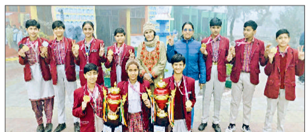
जींद। पदक विजेता बच्चों को सम्मानित करते हुए।